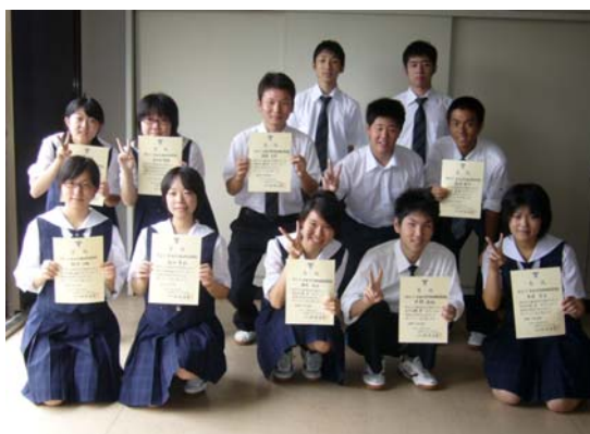
学園オリンピック入賞者(高校生)

五日間、いつもと違う環境で、全国から集まった仲間達と全力で好きなことを学ぶ。私にとってこのセミナーは、想像していた以上に楽しく、そして実りのあるものとなりました。今後もこの経験を様々なことに活かして行きたいと思います。