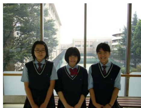
学園オリンピック入賞者(中学生)