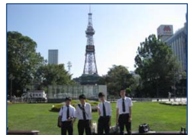
札幌・テレビ塔の前で