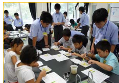
葉脈でしおり作り(理科)

9月20日(土)に、第2回中等部オープンキャンパスが行われました。地域の小学生を対象に、中等部の先生が体験授業を行いました。210組 500名を超える参加者を迎えて相模中等部を体験していただきました。本校教員と生徒が用意した魅力あふれる授業を小学生たちも楽しんでいただけたようでした。