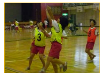
盛り上がった3年女子バスケット