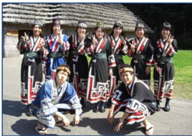
アイヌ民族衣装を着て