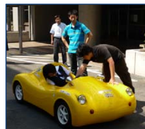
電気電子工学科の授業