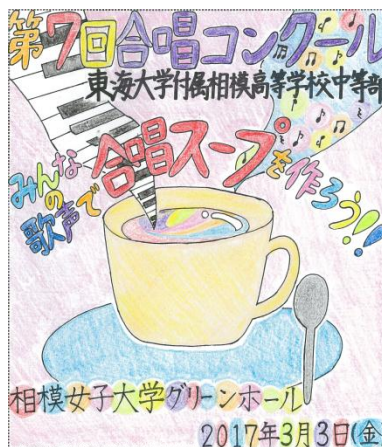
合唱コンクールポスターコンテスト