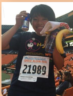
ホノルルマラソンにて記念撮影

☆ ハワイ中期留学 (SHIP) : 期間 2016 年 1 月 4 日(月)～2 月 25 日(木)