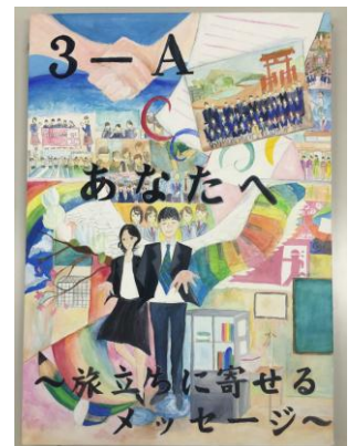
自由画イメージ画部門