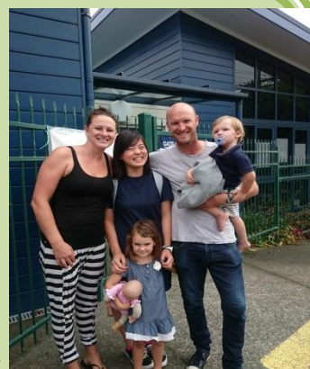
ホスト・ファミリーと思い出の1枚