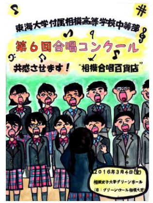
合唱コンクールポスターコンテスト