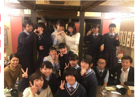
大阪道頓堀コース