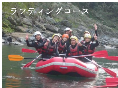
ラフティングコース

今回の修学旅行で一番思い出に残っているのは、タクシー研修です。事前に行きたい場所やまわる順番を調べて、グループごとに計画を立てました。京都で食文化に触れたり、たくさんの歴史を学んだりできました。私たち旅行委員も全員で協力して、とても良い修学旅行になりました。