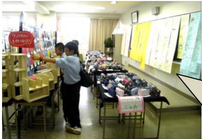
皆で楽しく品評会

10月3日(土)・4日(日)に行われました建学祭。両日も天候に恵まれ、大いに賑わいました。直前まで各係、各委員会、そして各クラブではたくさんの生徒が一生懸命に準備を進めてきました。そして、各教科の工夫あふれる学習展示や文化部の生徒たちが長い時間をかけて取り組んできました。今年度の建学祭のテーマである「歩み」を存分に表現することができました。