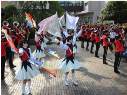
♪祭典のスタートを飾るパレード