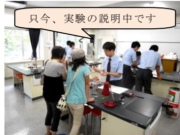
只今、実験の説明中です