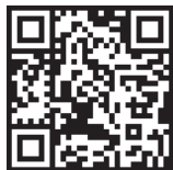
写真アップロード